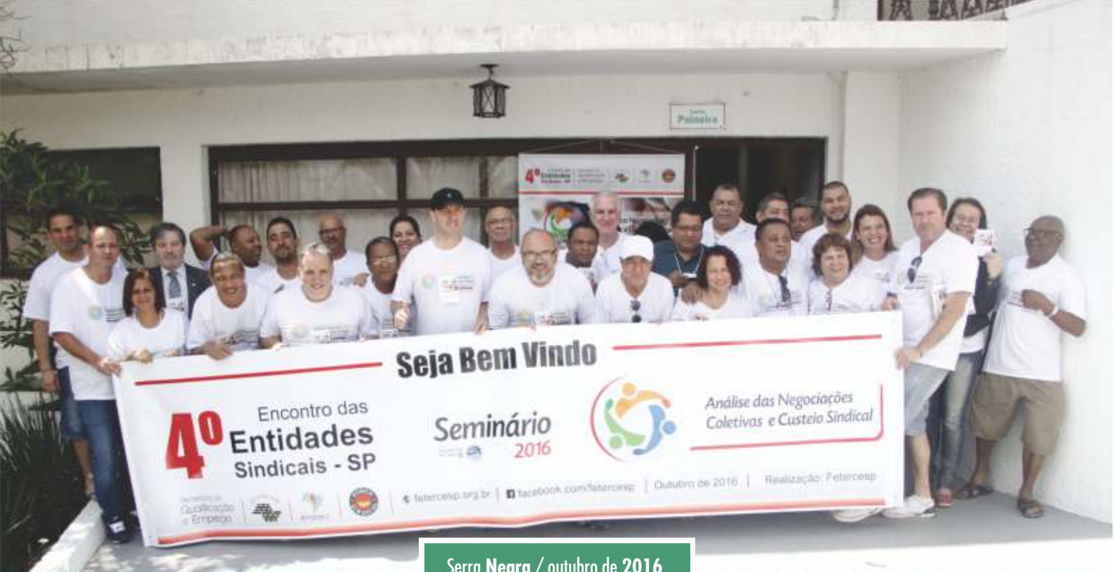
Serra Negra / outubro de 2016