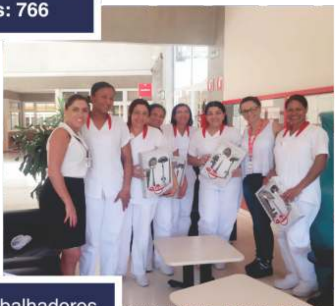
Total de Trabalhadores visitados: 4.909