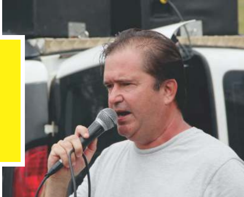
Presidente Paulo Ritz durante mobilização

E ste ano o Sindicato foi bastante atuante fiscalizando e combatendo o desrespeito aos direitos da categoria por parte de algumas empresas de Refeições Coletivas.