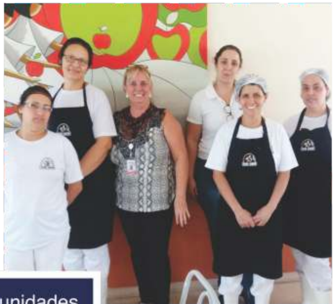
Total de unidades visitadas: 766