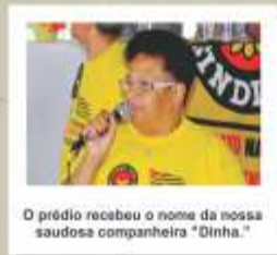
O prédio recebeu o nome da nossa saudosa companheira "Dinha."